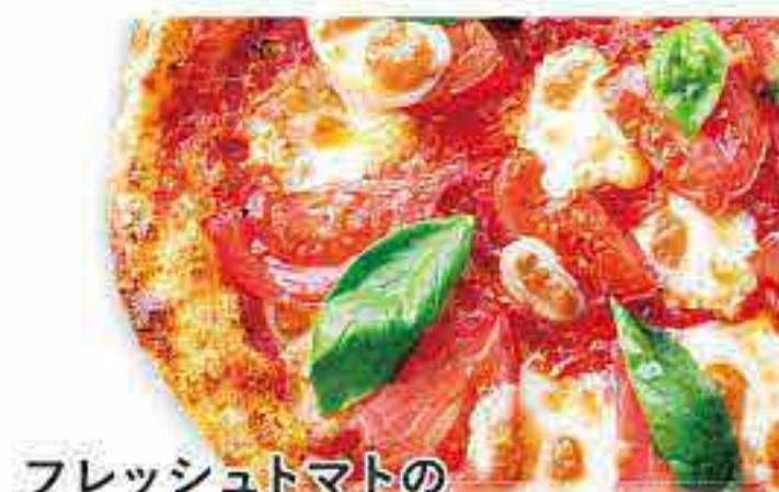
フレッシュトマトの マルゲリータ