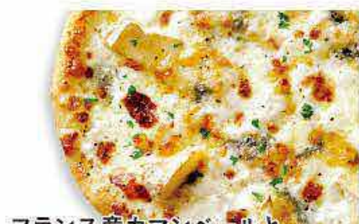
フランス産カマンベールと 世界の厳選チーズ

アンチョビ・フレッシュトマト・ガーリックスライス オレガノ・EXVオリーブオイル・特製チーズ トマトソース