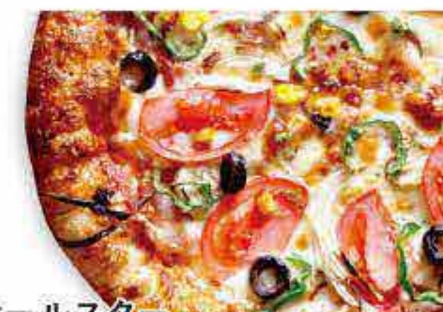
オールスター デラックス

サラミ・ベーコン・ウィンナー・トマト・マッシュルーム オニオン・ハラペーニョ・バジル・コーン・チーズ トマトソース