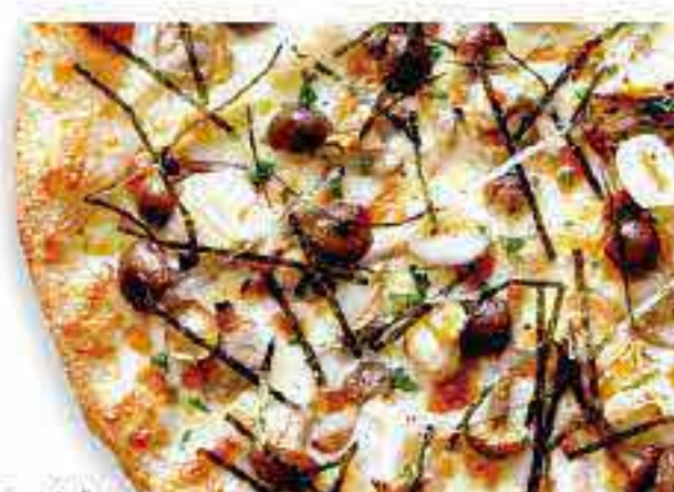
ホワイトソース きのこの和風シーフード

テリヤキチキン・テリヤキソース・スクランブルエッグ マッシュルーム・長ねぎ・きざみ海苔・特製チーズ マヨネーズ