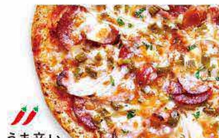
うま辛い メキシカン

ペパロニサラミ・イタリアンソーセージ・ベーコンピッツ ブラウンマッシュルーム・パルミジャーノレッジャーノ 特製チーズ・トマトソース