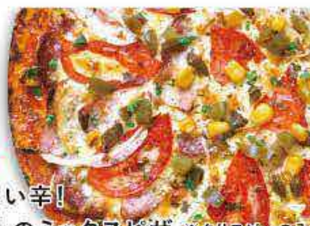
ちょい辛! 大人のミックスピザ ※クリスマスのみ イタリアンミックス

サラミ・ベーコン・ウィンナー・オニオン ハラペーニョ・フライドオニオン・マッシュルーム 特製チーズ・トマトソース