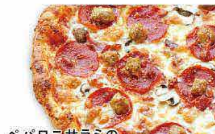
ペパロニサラミの アメリカンミート

エビ・いか・あさり・貝柱・オニオン・ピーマン フライドガーリック・パセリ・特製チーズ・トマトソース