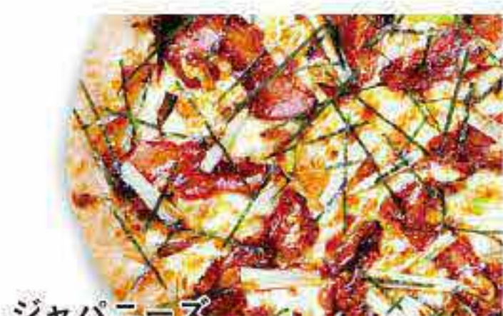
ジャパニーズ テリヤキチキン

カマンベール・ゴルゴンゾーラ・マリボ・ゴダ マスカルポーネ・パルミジャーノレッジャーノ パセリ・粗挽きペッパー・特製チーズ