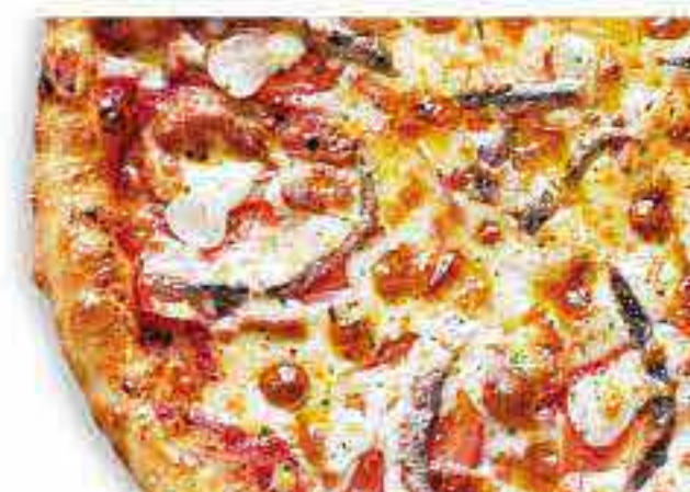
アンチョビとトマト