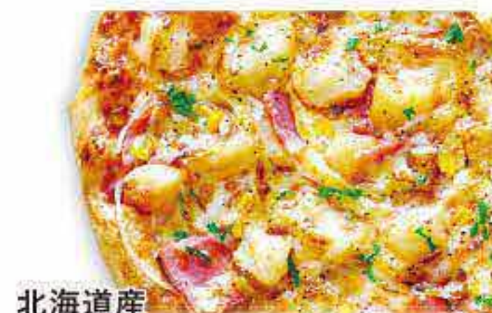
北海道産 ジャーマンポテト

フレッシュトマト・フレッシュバジル・モッツアレラチーズ グランド海塩・パルミジャーノレッジャーノ EXVオリーブオイル・特製チーズ・トマトソース